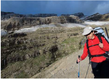
Belle lumière matinale, mais un ciel encore incertain.

Pas d'images des falaises rougeoiantes du Cirque au coucher du soleil : nous étions dans le nuage. Heureusement, celui-ci s'est enfoncé dans la vallée et nous démarrons au petit matin avec du bleu au ciel et des sommets presque dégagés... et c'est très beau.