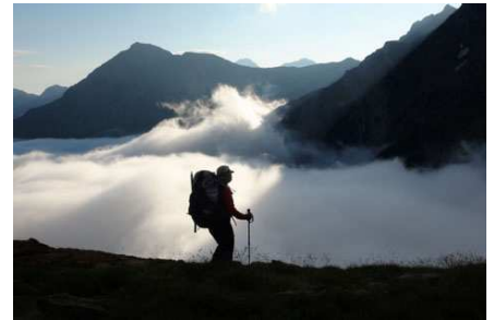
Gavarnie est dans le nuage.

Nous touchons le fond au wp 35 et suivons un chemin... qui doit bien mener quelque part. Nous arrivons sous l'Hôtellerie du Cirque et un pont nous permet de traverser. Nous aurions bien pris un café chaud en terrasse... mais tout est fermé. Nous nous dirigeons donc vers le départ de notre chemin (wp 36). Il est marqué « plateau de Pailla ».