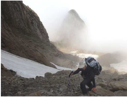
Montée du couloir; la Borne apparaît derrière nous.

ces aux éboulis fuyants. Enneigé, ce couloir a une autre gueule. Aujourd'hui, le peu de neige qui reste sur le quart supérieur est très dure... et nous préférons terminer par les rochers.