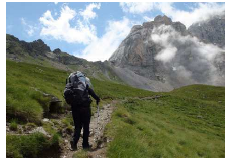
Arrivée à la Hourquette d'Alans.