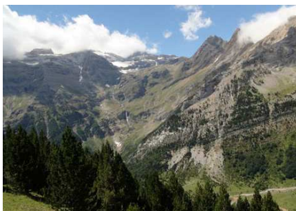
D'ici, nous voyons ce que nous avons descendu dans la matinée: du glacier du Mont Perdu au plat de la Larri.

ges, nous perdons les traces, cherchons et avançons au jugé. Enfin, nous repérons une piste, très à droite de ce que nous indique le GPS. Nous la remontons jusqu'au wp 52 où nous coupons plein est. Bien joué, nous retombons sur notre piste et les vieilles marques du GR (wp 53).