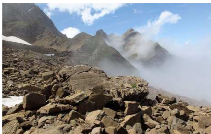
Un itinéraire très accidenté.

Par excès de confiance, je n'avais pas pris la carte IGN au 1:25000. Il me semble bien reconnaître, dans les éboulis, la trace horizontale menant directement à la Borne de Tuquerouye, mais le brouillard est à « couper au couteau » et je n'ose pas la prendre. Nous restons donc sur le sentier du Cirque d'Estaubé, espérant trouver quelques indications. Vers 2180m, nous apercevons divers cairns nous invitant à remonter. Parvenus à la trace que nous aurions dû emprunter, je prends le wp 39. Nous avons perdu