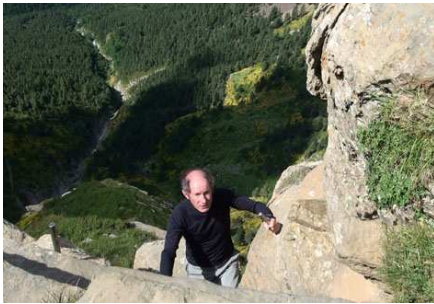
Sans le sac, l'exercice est amusant.

manœuvres, nous allons rester près d'une heure sur ces fameuses clavijas. Nous en sortons au wp 24 à 2175m. À