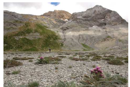
Llanos de Salarons, direction Col Blanc.

Après une heure d'efforts, nous voici donc au Col Blanc (wp 30).