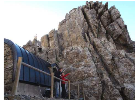
Le refuge de Tuquerouye, audacieusement installé sur la Brèche.

Nous voici arrivés à cet audacieux refuge, récemment restauré (matelas et couvertures pour une dizaine de visiteurs). Trois jeunes très sympathiques nous accueillent. Nous allons passer une excellente nuit.