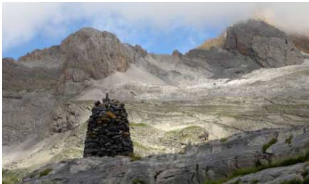
Les Gabiétous se dévoilent enfin.

Nous accédons à un premier étage, puis à un second qui est celui des Llanos de Salarons. Wp27 à côté