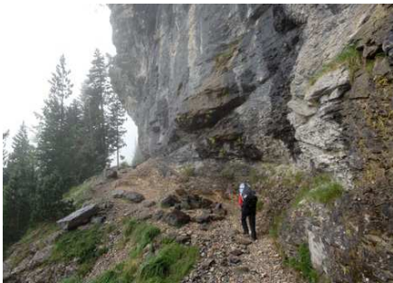
La montée au Plateau de Pailla.

min dans une zone marécageuse. Nous le trouvons enfin, plus à gauche, il rejoint la HRP : nous ne le perdrons plus. Il laisse sur la gauche la montée au Piméné et poursuit sur la Hourquette d'Alans. Les brumes se déchirent quelque peu et je prends enfin des photos. Nous passons la hourquette (wp 38) et déjeunons à l'abri du vent.