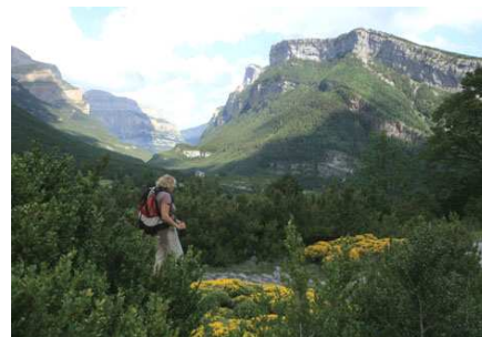
Le GR11 nous offre cette vue sur la vallée d'Ordesa... d'où nous repartirons.

la, où nous avons nos petites habitudes, pour prendre, le lendemain matin, la navette du Parc National d'Ordesa.