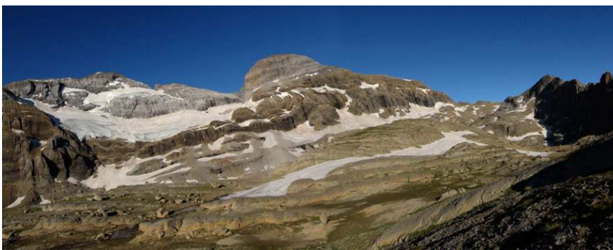
Depuis le Lac Glacé, nous avons cette vue magnifique sur des sommets emblématiques : le Mont Perdu et son glacier de la face nord, le Cylindre du Marboré et, à droite, la crête des Astazou.

Au réveil, nous constatons avec plaisir que le ciel est bien dégagé. Je peux prendre, enfin, les vues espérées sur la face nord du Mont Perdu.