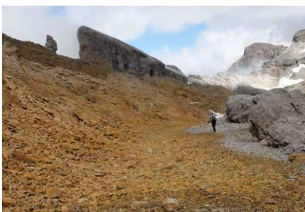
Un itinéraire remarquable, facile et sauvage, face aux murailles de la Brèche.

Un groupe de jeunes nous a rattrapé dans la montée au col... et nous nous sentons moins seuls. Après une petite pause photo, nous partons à l'horizontale dans les éboulis en direction du Doigt de la Fausse Brèche. Nous suivons les cairns dans un défilé