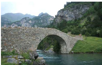
Le vieux pont de Bujaruelo.

Il est possible de rallier San Nicolas de Bujaruelo au Parc National d'Ordesa en suivant le GR 11. Nous ne l'avons pas fait cette fois-ci mais, autant que je me souvienne, l'itinéraire