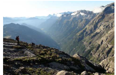
La vallée de Pinède dans laquelle nous allons plonger.

Un panneau indique « llanos de la Larri »; nous remontons la piste et arrivons en 45 mn au « refuge de la Larri » qui n'est autre qu'une cabane de bergers dont une partie (nue) est ouverte. Un conseil : prenez de l'eau aux sources que vous trouverez le long de la piste, car sur les llanos, il faudra la partager avec les troupeaux.