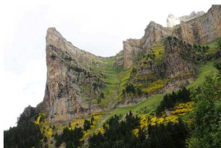
Le Tozal défie les meilleurs grimpeurs ... ainsi que nos regards.

pour nous élever... jusqu'à escalader de gros blocs (wp22). Cela fait la quatrième fois que je passe dans le coin et je suis toujours surpris. Existe t-il d'autres variantes ? Ce n'est pas im-