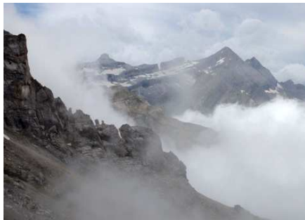
Taillon, Brèche et Casque émergeant des nuages.