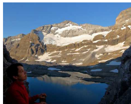
Récompense à l'arrivée à Tuquerouye : le ciel se dégagera et cette vue du Mont Perdu s'offrira à nous.

Mais en fait, par sagesse, nous sommes allés au plus direct. Il fallait économiser notre énergie dans ces gros dénivelés puisque, après les Sarradets, le projet était de s'offrir une nuit de rêve... sur la Brèche de Tuquerouye.