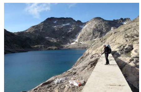
Le barrage de Bramatuero superior et, à gauche, le col du Letrero.

Il faudra plus d'une heure pour accéder au second lac, mais le chemin est régulier, les vues sont magnifiques et nous faisons des photos. Nous arrivons au Bramatuero alto à gauche du barrage que nous franchissons (wp 12) et escaladons les gros rochers glaciaires de droite pour y trouver notre itinéraire et faire une petite pause.