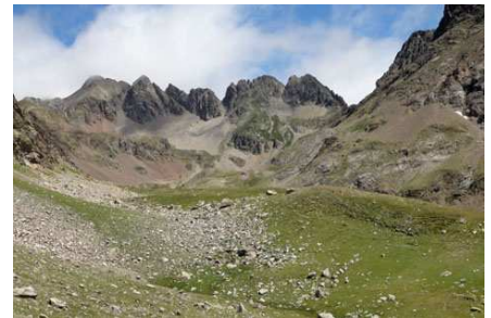
Les derniers pâturages du rio Ara devant les Aiguilles du Chabarrou.

contournons ainsi par la gauche un chaos de blocs et d'éboulis (wp 16) et trouvons derrière un petit sentier longeant le rio Ara en rive droite. Nous nous rapprochons ainsi du confluent avec le torrent de los Batans et du passage à gué du wp 17. Le cadre est magnifique et nous prenons une heure pour déjeuner.