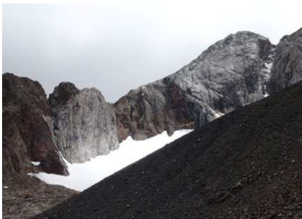
Une éclaircie sur les parois de l'Enfer.

Nous reprenons notre descente en direction des Ibóns Azules. Ce site, dominé par les imposants Pics d'Enfer et leurs parois caractéristiques, est magnifique. Il offre de merveilleux emplacements pour les bivouacs, mais aujourd'hui nous ne verrons pas grand-chose. Même la cabane en tôle des Azules inférieurs a disparue de nos