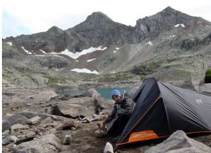
Bivouac devant l'Arriel à Arrémoulit.

Ce chemin nous inquiète un peu car il n'en finit pas de monter alors que nous nous attendions à descendre. Normal, Respumoso n'est qu'à 50 m sous les lacs d'Arriel et l'itinéraire est presque horizontal. Nous descendons enfin et arrivons sur un terre-plein (wp 04). Le GR 11 y est signalé. Nous descendons nous abriter sous le porche de la chapelle (fermée), au niveau du barrage.