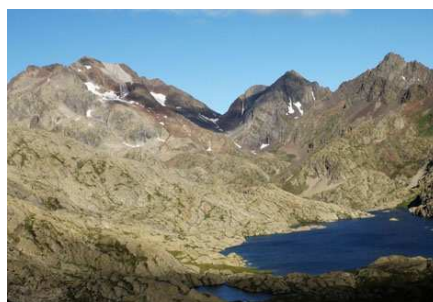
On s'élève au-dessus de l'embalse de Bramatuero inferior.

Port du Marcadau et repérons notre chemin qui serpente à gauche de celui provenant du lac inférieur de Bramatuero. Sous le barrage, vous verrez une construction en forme de borne monumentale. C'est derrière, à droite, que vous trouverez votre chemin au wp 11. Il suit une faille, s'élève et redescend le long du lac.