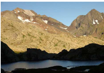
Les premiers rayons sur les Pics d'Enfer et de Piedrafita, à droite.

Enfin la récompense ! Le ciel est dégagé, nous sommes secs, en pleine forme... et nous allons donc nous faire plaisir. N'hésitez pas à nous suivre sur cette nouvelle HRP. Elle est rapide, un brin sauvage... vraiment belle et sans problème.