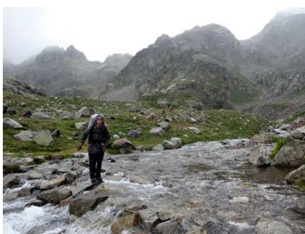
Passage à gué des lacs d'Arriel.