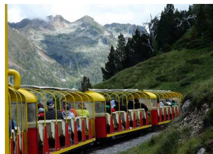
Le petit train d'Artouste : une façon agréable d'approcher les sommets.

Nous bivouaquons au bord du lac d'Arrémoulit sous une succession d'averses. Au réveil, nous devinons une amélioration... à tort car les choses empirent. Le franchissement des cols de Piedrafita et d'Infierno dans des bourrasques glaciales est dantesque. L'endroit, ce jour là, méritait bien son nom. Ce fut l'enfer !