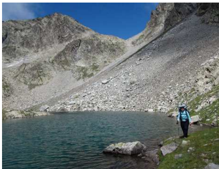
Joli petit lac devant le col du Letrero.

temps à chercher le départ du chemin le plus direct, mais comme j'en ai un mauvais souvenir, j'abandonne l'idée et je reviens au collet herbeux (wp 15)