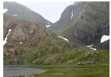
En fond, le col d'Enfer depuis le premier Azules. Dessous: la cabane de Bachimaña.

Nous pensions bivouaquer, mais comme la journée a été rude et humide, c'est sous son toit que nous allons nous sécher et passer la nuit.