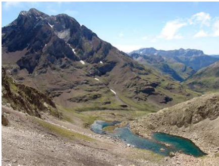
L'ibón de los Batans et le Vignemale.

Face aux murailles ouest du Vignemale, le début de la descente sur des blocs instables est difficile mais elle est cairnée et la trace devient évidente à l'approche du très joli petit lac nommé Ibón alto de los Batans, atteint en 3/4 d'heure, et où nous nous reposons. Nous passons également du