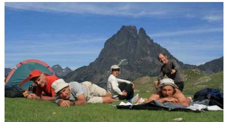
Les copains agenais... et un campement sur les rives du lac Gentau.

La descente sur le refuge est très rapide (wp 65). Il est complet, nous le savions et nous serons beaucoup mieux sur les pelouses du lac Gentau où nous retrouvons des copains du CAF d'Agen.