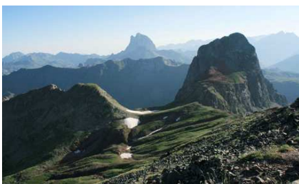
Le Pic d'Anayet devant l'Ossau.

Anayet (2240m) 10h 20 1h 35 Corral de las Mulas 11h 55