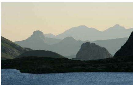
La magie des lumières matinales.