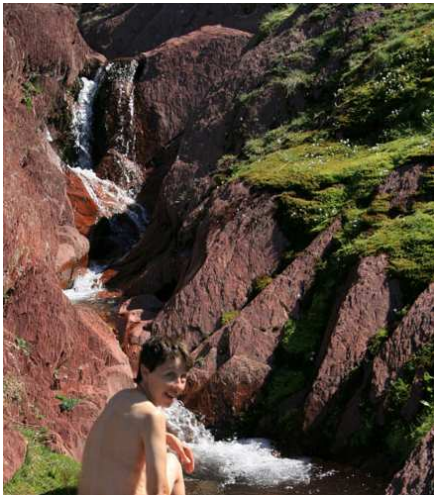
Ah ! Vertice de l'amour...

wp 80 où nous trouvons panneaux et remontées mécaniques de la station de Formigal. Un cheminement cairné nous invite à descendre dans un goulet encombré de blocs et nous en sortons au wp 81. Nous poursuivons à l'horizontale et tombons très rapidement sur un excellent chemin indiquant Anayet à 20 mn. Ce chemin est rejoint par celui qui monte dans le vallon de la station et nous arrivons donc sur le vaste plateau où se niche le lac d'Anayet. Un décor de rêve.