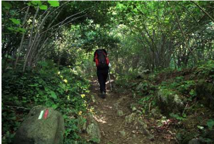
Un GR 10 bien sympathique.

Nous faisons des pauses, prenons des photos... et prenons notre temps. La vallée s'élargit enfin, nous apercevons notre destination, le col d'Ayous, mais nous faisons halte à la cabane de St-Cours (wp62) pour nous restaurer et discuter avec des randonneurs de passage.