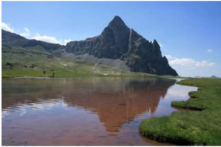
Le Pic et le lac d'Anayet: décor de rêve.

Puerto de Canal Roya (2130m) 13h 45 1h 30 Ibones de Anayet (2240m) 15h 25