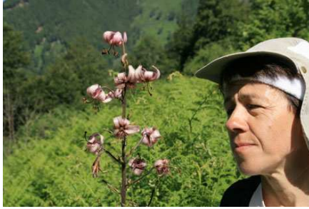
Un lys Martagon de grande taille.