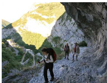
Dès le départ, les points de vues sont saisissants. En fond : les fortifications du Portalet qui verrouillaient la vallée.

est régulière (forcément) et la progression est rapide.