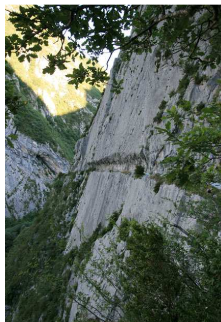
Le Chemin de la Mâtre est taillé dans une falaise calcaire presque verticale. L'Histoire profite aux randonneurs.

Ce chemin taillé au XVIIIème dans la falaise pour descendre les fûts de hêtres destinés à la marine à voile, est surprenant. Il offre des vues plongeantes à couper le souffle sur les abîmes de la gorge du Sescoué, qui débouche sur le gave d'Aspe. La pente