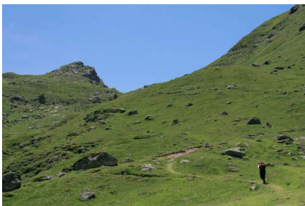
Le col d'Ayous est tout au fond... On y arrive face à l'Ossau... Et on poursuit sur la crête et de belles traces jusqu'au sommet.