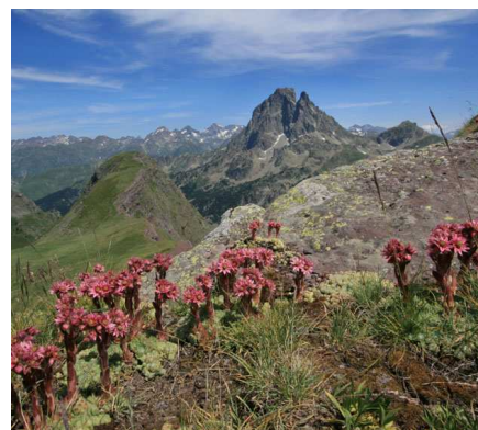
Le Pic d'Ayous offre une vue exceptionnelle sur le massif de l'Ossau...et cultive un « artichaut des murailles » très coloré.

Ensuite, il fallait remonter jusqu'à la crête frontière, aérée, élégante et rapide, la parcourir jusqu'au Pourtalet... ou s'offrir une petite fantaisie. Un petit « bonus », en allant bivouaquer aux lacs d'Anayet pour fêter, au pied du Vertice, notre semaine de randonnée... et toujours avec l'Ossau en point de mire.