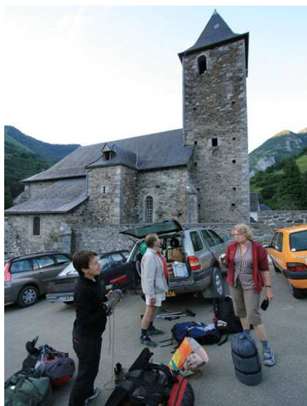
Village de Borce : l'équipe se prépare à affronter une nouvelle journée.