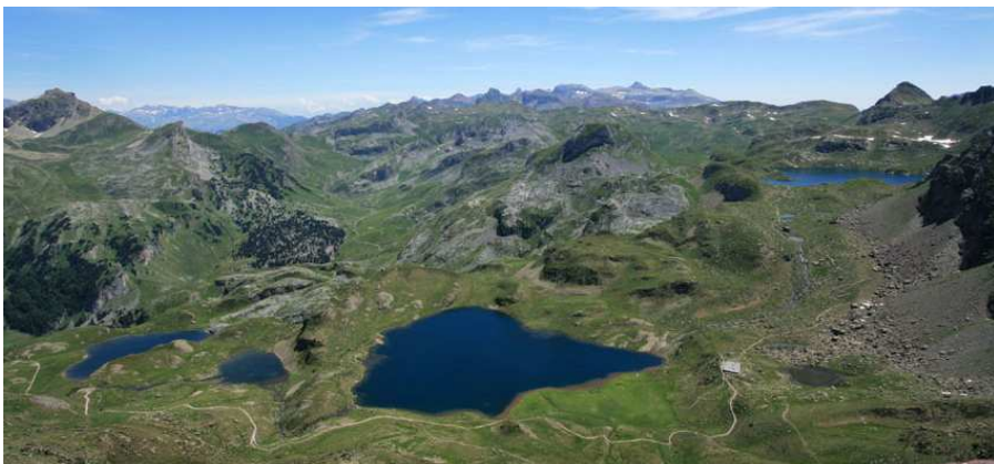
Au pic d'Ayous, nous parcourons du regard, l'itinéraire du lendemain.