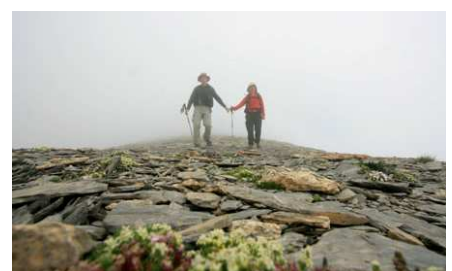
Table des 3 Rois: une vue incomparable !!! sur les montagnes du cirque de Lescun.

Le cheminement nous apparaît bien compliqué mais, à l'analyse, nous comprenons que nous avons suivi la frontière... au plus direct. Nous nous retrouvons ainsi, heureusement surpris, sur la Table des Trois Rois. La visite est rapide... le temps d'une photo. Car vu l'incertitude de la météo, nous avons abandonné l'idée d'y passer la nuit. Nous prenons le wp31 et basculons à l'inverse de notre point d'arrivée.