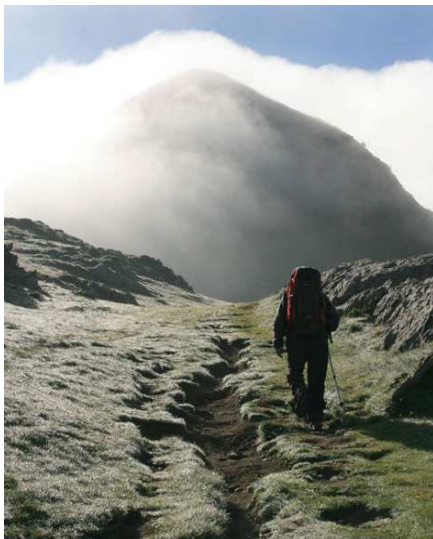
Lumières argentées vers le pic d'Arlas.

Ce col n'est sûrement pas très fréquenté. Il est tout de même repéré par deux très gros cairns entre lesquels nous prenons le wp21.