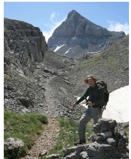
Un itinéraire peu couru mais évident.