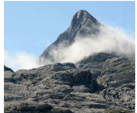
Le Pic d'Anie règne en maître sur un territoire fascinant.

De la Pierre St-Martin au Pic d'Anie nous traverserons un vrai glacier pétrifié en zigzagant entre ses crevasses. Mais rassurez-vous, le sentier est balisé. Après, ça se complique... surtout lorsque le brouillard vous tombe dessus. Il faudra m'excuser pour la description des paysages. En 96, par temps clair, nous n'avions pas trop cherché. En 2009, heureusement, nous avons un GPS. C'est moins poétique, mais beaucoup plus sûr !