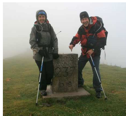
Décidemment, il ne me sera pas donné de démarrer à la 237 avec le soleil.

Domage, car nous avons évolué sur des croupes faciles dominant des collines verdoyantes et d'immenses pâturages. Par temps clair, la vue s'étend très loin au-dessus des plaines.