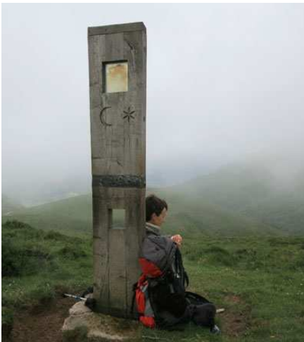
Une œuvre d'art qui nous dépasse... mais qui nous protège du vent.

Le brouillard se déchire pendant quelques secondes pour nous permettre d'apercevoir l'échancrure des gorges de Kakoueta. Coté espagnol, les paysages se dévoilent plus longuement. Nous leur faisons face et mangeons adossés à un totem ?... En tous cas... une œuvre d'art « qui nous dépasse ».