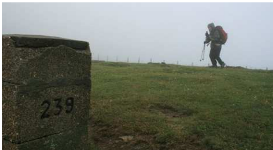
Les bornes frontières sont de précieux repères.

À droite, l'Otchogorrigna hésite à se montrer.