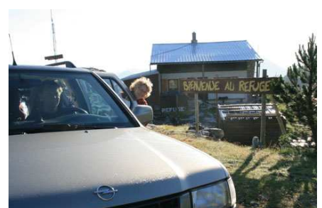
Le refuge Jeandel nous offre un relatif confort, mais nous aurions pu également utiliser la cabane du col de la Pierre St-Martin... ou le refuge de Belagua.

Nous nous faisons récupérer à la frontière et nous passons une excellente nuit de repos au refuge Jeandel dans la station de ski d'Arette.