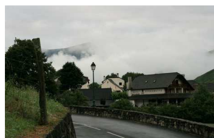
De Larrau, on aperçoit à peine la crête du Pic d'Orhy. Le ciel ne se dégagera pas et il faudra se résoudre à brouter l'herbe que nous avons sous les pieds.

Nous passons au Betzulagagna (wp02), au Gaztarrigagna (wp03), nous descendons, remontons légèrement et, après la borne 244, au wp04, nous dévions sur la gauche pour couper les pentes de l'Otchogorrigna. Nous tombons rapidement sur un ancien balisage et nous poursuivons en direction d'une échancrure caractéristique sur la crête n.o. de l'Otchogorrigna (wp05) où nous faisons une petite pause.