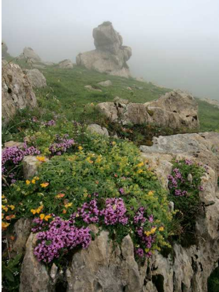
Nous nous sommes égarés mais nous ne le regrettons pas...

Nous avons aperçu pendant quelques secondes le vaste col vers lequel un sentier évident se dirige. Il s'agit du col d'Uthu (bf 247, 1664m). Le brouillard est dense et, heureusement, un balisage récent (rouge et blanc) sur des poteaux, nous rassure. On peut le perdre cependant après franchissement d'un ruisseau. Monter alors vers le nord-est et naviguer sur le wp06.