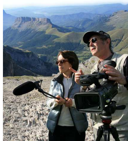
Ci-dessus : « c'est du lourd ». Ci-dessous : la version light AVCHD.

Le premier travail sera de télécharger le caméscope des images de cet été et de réaliser quelques essais en juxtaposant des plans des deux caméras. Ceci dans le but d'affiner les réglages et d'être prêts pour cet été.