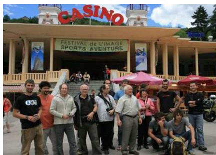
À défaut de monter les marches du festival de Cannes, nous avons monté celles du casino d'Ax-les-Thermes.

Côté particuliers, les choses se calment mais comme nous sommes présents sur divers sites, nous recevons encore quelques commandes. Si bien que, les premiers 300 DVD étant épuisés, j'en ai fait graver 50 puis 60 de plus. Ce n'est pas énorme mais, hormis les frais de gravure et d'envoi : c'est pour notre poche. En laisser en dépôt à droite et à gauche compliquerait les choses. Les intermédiaires ne sont pas des philanthropes... et je ne sais même pas si nous avons le droit d'aller plus loin dans notre démarche commerciale.